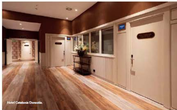
Hotel Catalonia Donostia.

De la misma manera, en CM4 Arquitectos consideran que "habitualmente, cuando nos enfrentamos a una rehabilitación, el edificio albergaba anteriormente un uso diferente, estaba deshabitado o en ruínas, por lo que