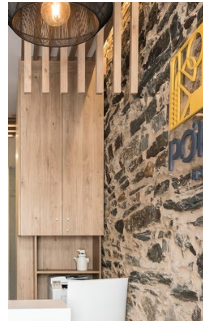
Hostal Pórtico – Betanzos - Equipo arquitectura: Arqnova Arquitectos. Equipo interiorismo: PF1 Interiorismo Contract