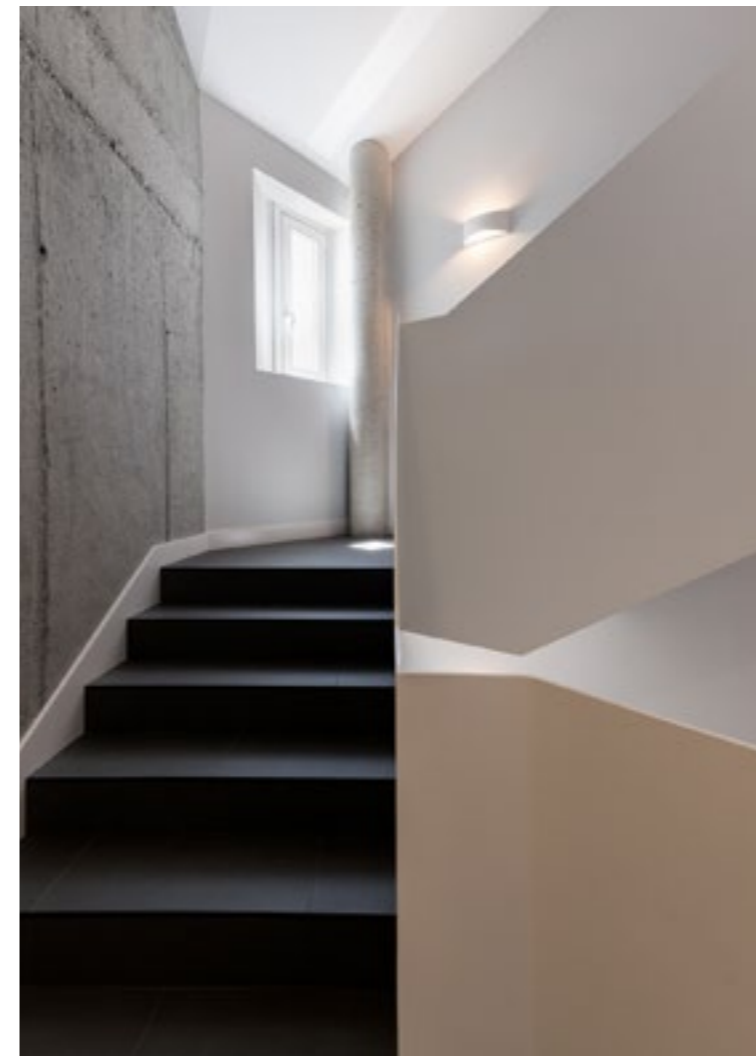
Hostal Pórtico – Betanzos. Equipo arquitectura: Arqnova Arquitectos. Equipo interiorismo: PF1 Interiorismo Contract.

Los espacios comunes se prestan mucho más para ese uso, de todas formas, hay equipos muy profesionales y creativos, que están realizando grandes trabajos. Todas estas fórmulas comentadas han sido utilizadas con anterioridad, pero ahora se están planteando de una forma más fresca y sobre todo intentando que sean lo más autónomas posible.